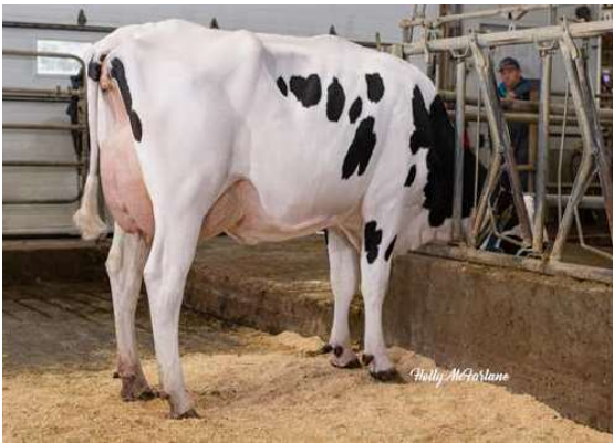
PROGENESIS TOPNOTCH MACIE