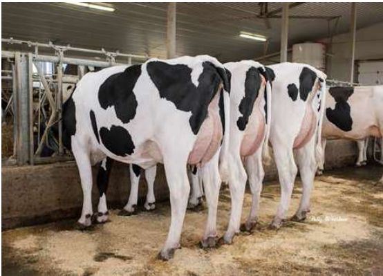
TOPNOTCH DAUGHTERS GROUP