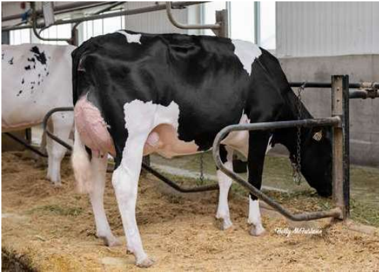
PROGENESIS TOPNOTCH OAKLEY