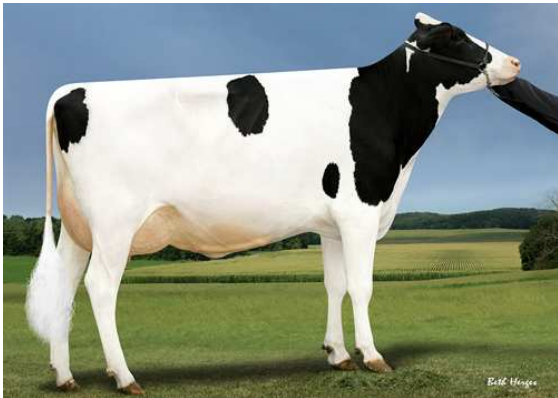
SANDY-VALLEY MD PLEASURE FOURTH DAM