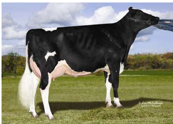
COOKIECUTTER MOM HALO