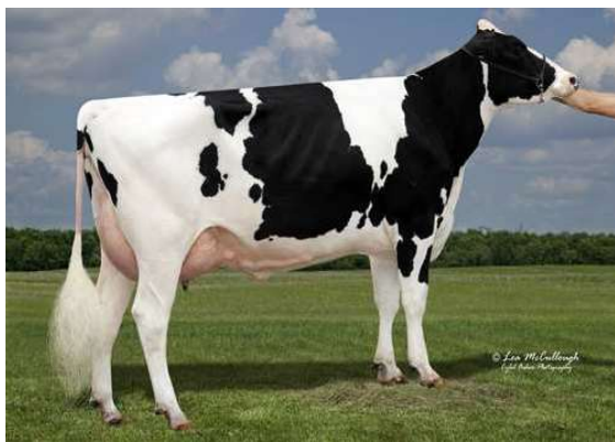
SYNERGY UNO POT O GOLD FOURTH DAM