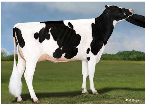
SYNERGY RUBICON PERFECT THIRD DAM