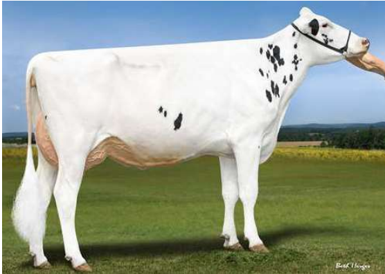
LADYS-MANOR GRNT OOHM