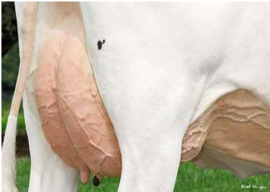
LADYS-MANOR GRNT OOHM