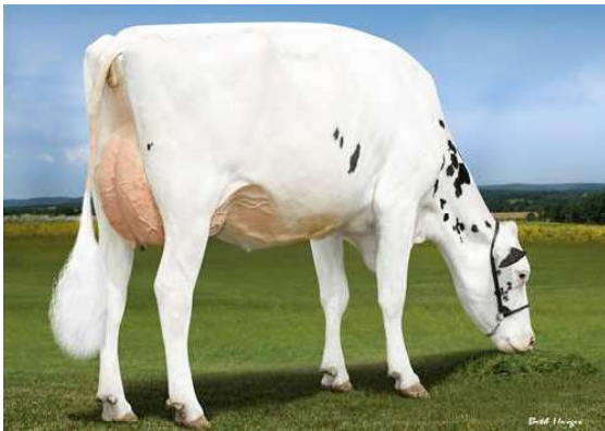
LADYS-MANOR GRNT OOHM