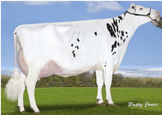
CALBRETT KINGBOY MIRANDA P THIRD DAM