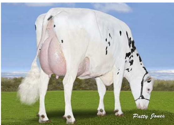
CALBRETT KINGBOY MIRANDA P THIRD DAM