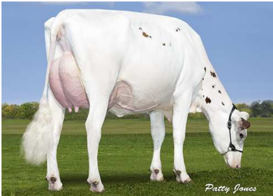
SNOWBIZ LADD P MARSHMELLOW FOURTH DAM