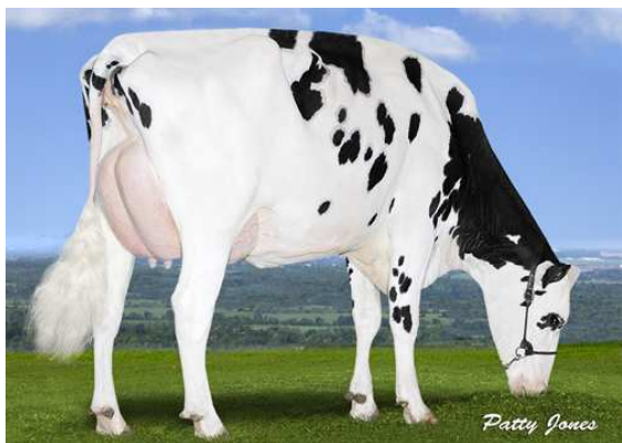
PEAK BOMBERO MAXIMA GRANDDAM