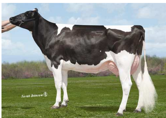
SULLY PLANET MANITOBA FIFTH DAM