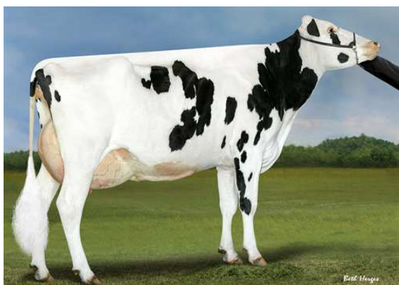
PROGENESIS DUKE MELEE DAM

SILVERRIDGE V IMAX PROGENESIS DUKE MELEE VG-87-5YR-USA 7* S-S-I MONTROSS DUKE PEAK BOMBERO MAXIMA VG-87-6YR-USA DOM RICHMOND-FD EL BOMBERO BRYHILL RANSOM MARQUISE GP-83-2YR-USA DOM 1*