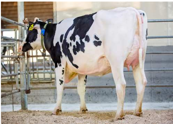
AOT DELUXE HI-LIGHTED DAM