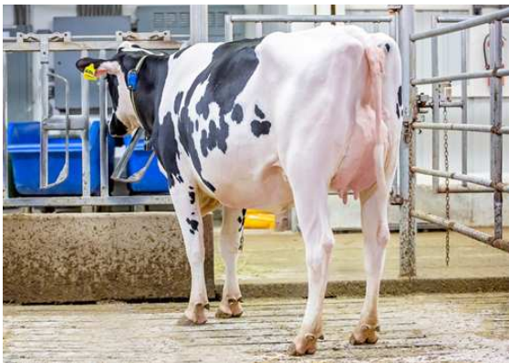
AOT DELUXE HI-LIGHTED DAM