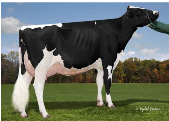
COOKIECUTTER DTA HABITAN FOURTH DAM